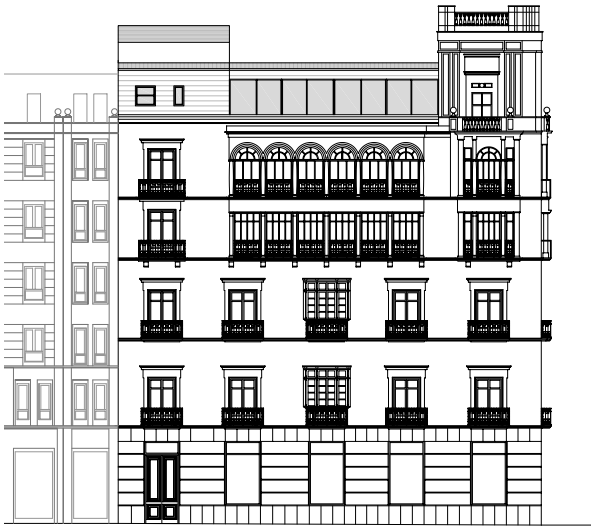
Alzado Puerta del Mar