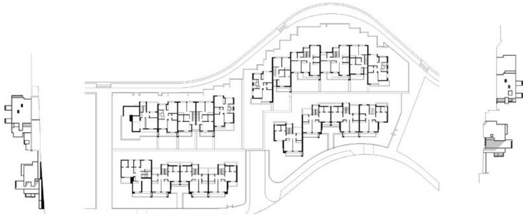
Planta alta y alzados